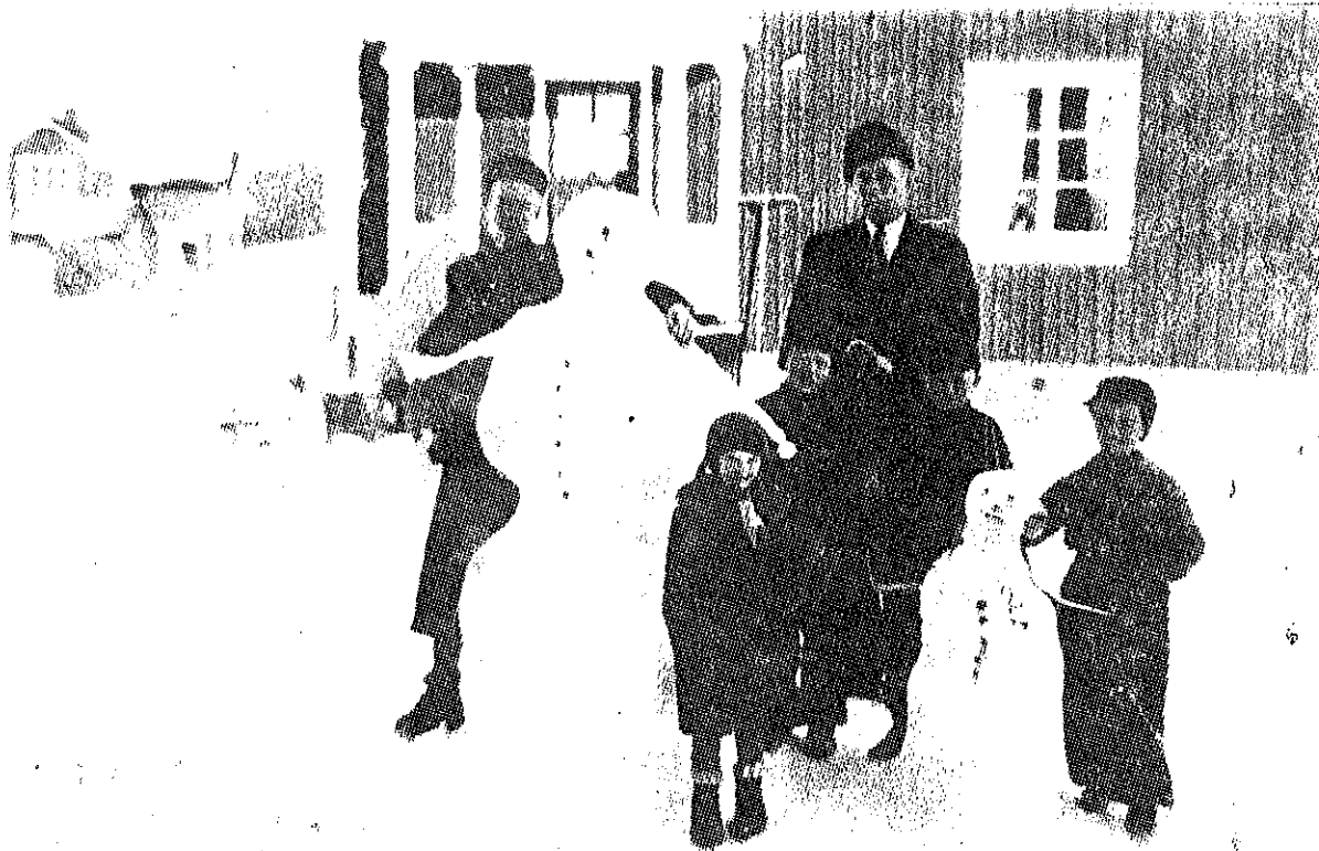
Utanför lärarpostaden vintern 1938