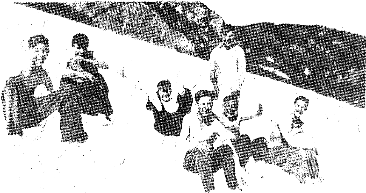
Fortsättningsskolan på fjällutflykt.