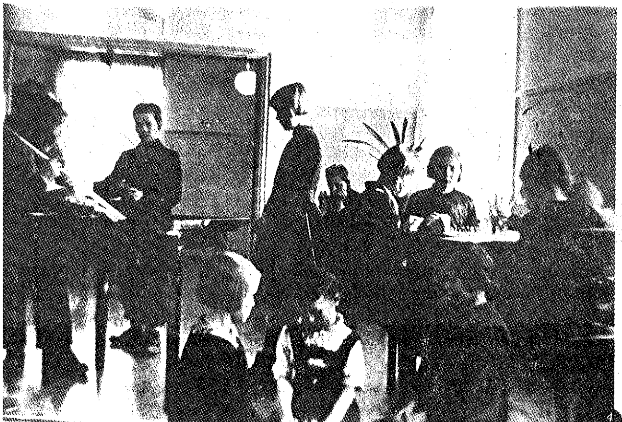
Från dagrummet 1935